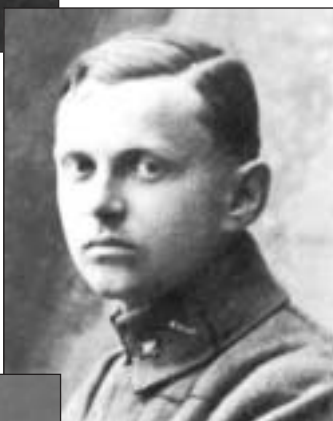
Ivan Merz časnik u prvom svjetskom ratu, na talijanskoj fronti, 1917.