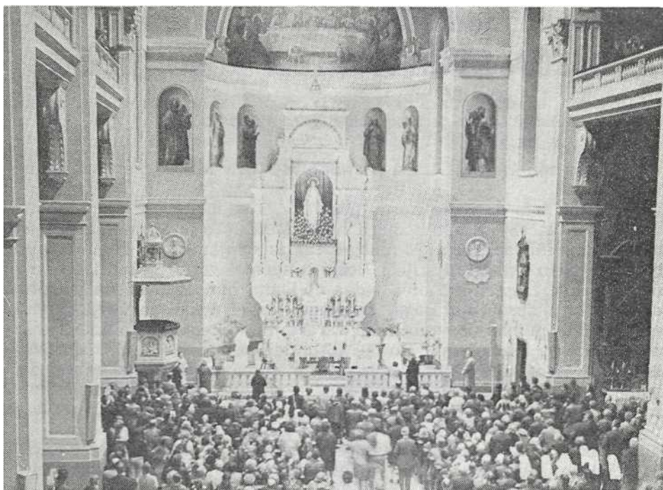
Mnoštvo štovatelja Ivana Merza prisustvuje koncelebriranoj sv. misi u bazilici Srca Isusova u Zagrebu prigodom 45. godišnjice smrti Sluge Božjega, 10. svibnja 1973.

U nedjelju 13. svibnja propovijed pod sv. misom u 11 sati u bazilici Srca Isusova bila je također posvećena Ivanu Merzu. Propovjednik je prikazao Merza kao čovjeka duboke vjere do koje se polagano razvijao i koja je na koncu preobrazila cijelo njegovo biće, njegov život i rad.