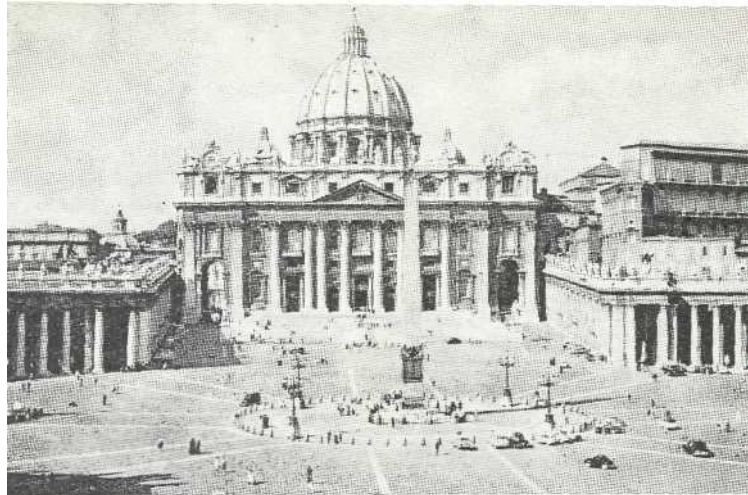
BAZILIKA SV. PETRA U RIMU

i najteže napore, a kamo se u rujnu ove godine sprema međunarodno organizirana omladina, zar da onamo ne pohrli i hrvatska omladina i ne polete vitezovi Kristovi — hrvatski orlovi?