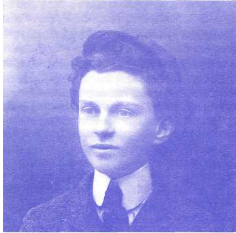
Ivan kao gimnazijalac

Zato svijet vas mrzi, jer od svijeta niste. Svijet i na me mrzi, kako da vas voli, Omrznutog Krista Vi ste apostoli! (Velimirović)