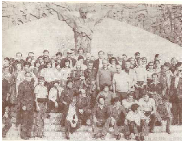
Vesela talijanska grupa pred Gupčevim spomenikom u Stubici

Lucio, Treviso — Italija: Doživjeli smo jedno iskustvo vjere u vašoj zemlji što nam je dalo snagu i poticaj za naš kršćanski život. Jedno ohrabrenje za nas da unatoč promjena, pred kojima Italija stoji, vjera će dalje živjeti.