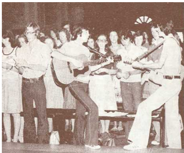
Irci su sve oduševili svojom pjesmom u crkvi i izvan nje. Na slici: u Bazilici Srca Isusova prilikom završne sv. Mise

tamburaški sastav iz Rečice kod Karlovca u narodnim nošnjama koji su otpjevali i odsvirali splet narodnih pjesama i kola. Muzičkom programu pridružila se i Irska grupa koja je izvela nekoliko irskih pjesama i plesova. Nakon pauze gostima je prikazan film »Crkva u Hrvata« i »Zdravo Djevice« te nekoliko nagrađenih filmova zagrebačke škole crtanog filma.