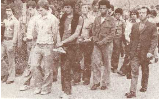
Grupa mladih iz Pariza sa svojim svećenikom u sabranoj molitvi

naši gosti obišli su Zagreb: najstariji dio, Kaptol i Gornji grad a potom Novi Zagreb. Pokazana im je nova crkva sv. Križa u Sigetu ali isto tako i župski centar u Zapruđu u jednoj novogradnji (stan preuređen u župsku crkvu, gdje nema nikakve nade da bi se u tom dijelu Zagreba koji broji već 200.000 stanovnika mogla izgraditi još koja crkva).