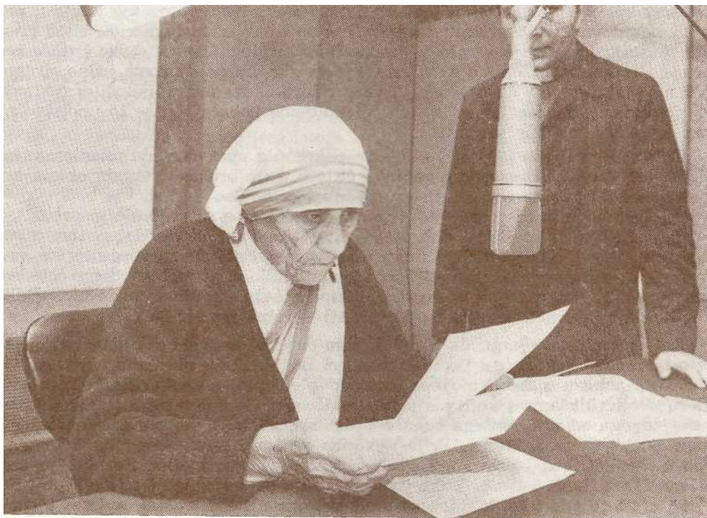
Majka Terezija emitira poruku preko radio Vatikana

3. Drugi veliki znak Isusove nazočnosti na zemlji jest rimski biskup, Sveti Otac, koji je Petrov nasljednik i, što je za nas najvažnije, Kristov Namjesnik. Preko Pape progovara nam sam Isus našim suvremenim jezikom. Sveti Otac nam autentično tumači Božju riječ i Njegovu svetu volju, daje nam rješenja u svjetlu