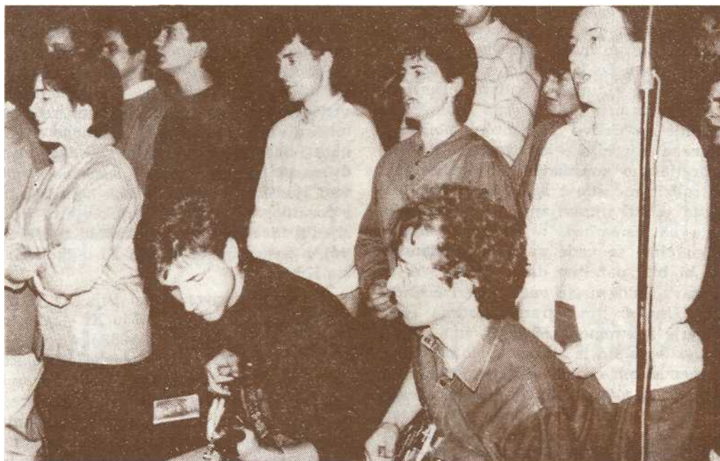
Mladi »Palme« sudjeluju sviranjem i pjevanjem

ko ne bi postojao »opravdan uzrok«. A to bi se moglo dogoditi kad bi (koja politička vlast stvorila nepravde zakone, koji bi pogadali i koje »dobro« ili »pravo« Crkve. Druga posljedica koja proizlazi iz ovoga jest superiornost Crkve nad drugim društvima, kojima je ona postavljena za »učiteljicu i vodiča«. Superiornost dolazi od superiornosti duhovnih nad vremen-