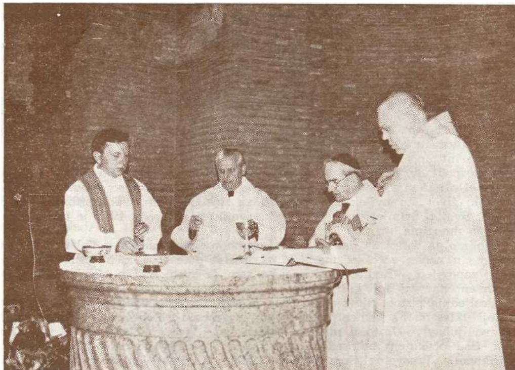
Kardinal Silvio Oddi predvodi Koncelebraciju

Činjenica da je Papa za njega Krist vidljiv na zemlji, Ivan će ponavljati bezbroj puta i izrazit će to u najrazličitijim oblicima i varijacijama u svojim brojnim spisima i konferencijama.