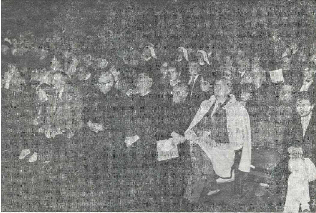
Stovatelji Ivana Merza na proslavi 90. obljetnice Ivanova rođenja

Na Merza je duboko djelovao slučaj koji je doživio u svibnju 1920. godine u St. Gabrielu, kada je sedamnaestorici novozaređenih svećenika-misionara bila upravljena riječ, misao propovijedi: »Propovjednik im je održao propovijed o žrtvama, koje ih će-