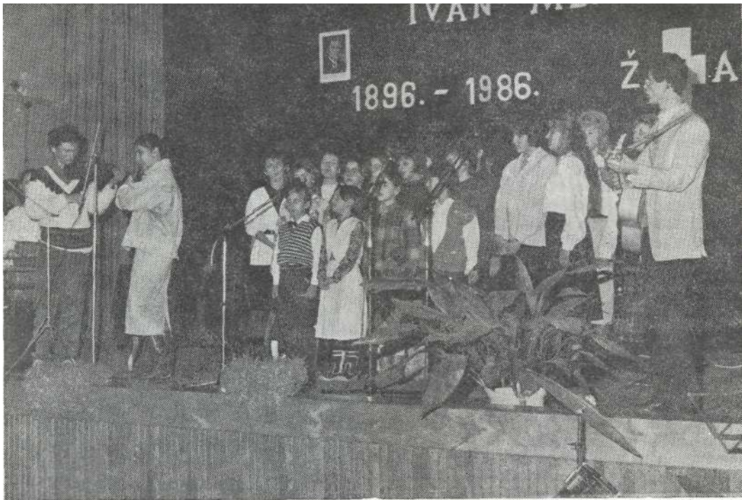
Mladi župe sv. Fabijana i Sebastijana iz Varaždina