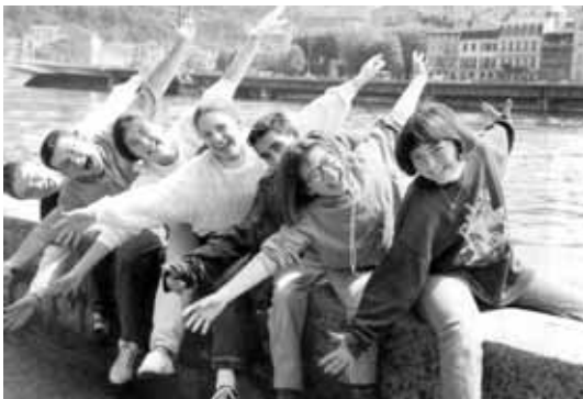
Radost i vedrina što daje Euharistija odražava se u životu ekipe - osnovne zajednice pokreta

U svojoj bazi pokret djeluje kroz skupine od pet do sedam članova koje se zovu ekipe. S njima je uvijek netko od odraslih, ili koji puta i netko od starijih mladih.