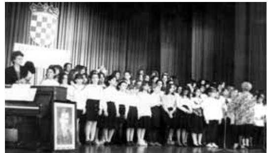
Svečana akademija za Dan Ivana Merza koji se slavi kao Dan škole koja po njemu nosi ime u Zagrebu