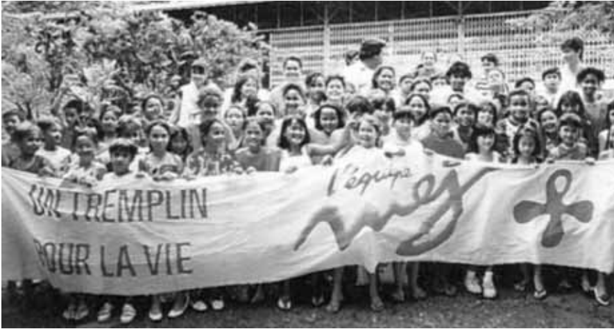
Na transparentu što ga drže članovi Euharistijskog pokreta mladih u Francuskoj piše: »Odskočna daska za život - ekipa MEJ (Mouvement Eucharistique des Jeunes)«

Veza s drugim pokretima - MEJ je član Apostolata laika. Prisutan je u drugim odgojnim pokretima mladih (Skauti, Fokolarini itd.).