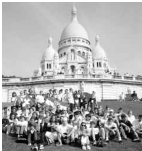
Mladi štovatelji Ivana Merza pred bazilikom Srca Isusova na Montmartru u Parizu

Krenuli smo još 13. kolovoza i prva četiri dana, prema ponudi organizatora iz Pariza, koju su uputili svim mladima iz inozemstva, proveli smo u