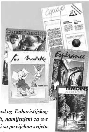
Časopisi francuskog Euharistijskog pokreta mladih, namijenjeni za sve uzraste, rašireni su po cijelom svijetu gdje pokret djeluje

Časopisi - Prva veza s pokretom je časopis. Svaki član u njemu nalazi sugestiju za život ekipe, prijedloge za refleksiju i razmjenu, ideje za osobnu i zajedničku akciju, putokaze za molitvu i čitanje Biblije, članke, svjedočanstva i drugo što daje veću otvorenost prema stvarnosti.