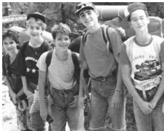
Mladež Euharistijskog pokreta njeguje i razne rekreativne aktivnosti: izleti, taborovanja ...

4. OTVARANJE DRUGIMA – AKCIJA znači odgoj za solidarnost, za angažman, za suočenje s realnošću te kršćanski apostolat.