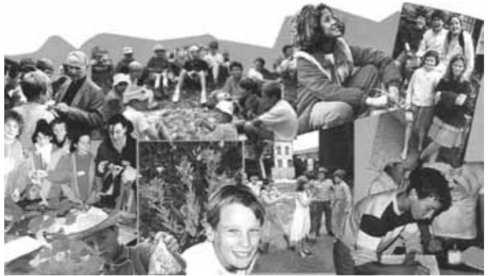
Razne aktivnosti članova pokreta u Francuskoj

ji pronaći njihovo jedinstvo. Kroz to vrijeme stavlja se u praksu program pokreta i nastoji se živjeti s mladima iskustvo kršćanskog zajedništva.