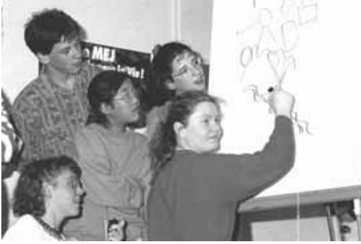
U ekipi svakome članu omogućava se da bude aktivan, da se izrazi na razne načine.