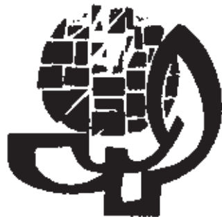
Simbol Međunarodnog euharistijskog kongresa, održanog u Lurdu 1981. predstavlja hostiju koja ujedinjuje razjedinjeni svijet