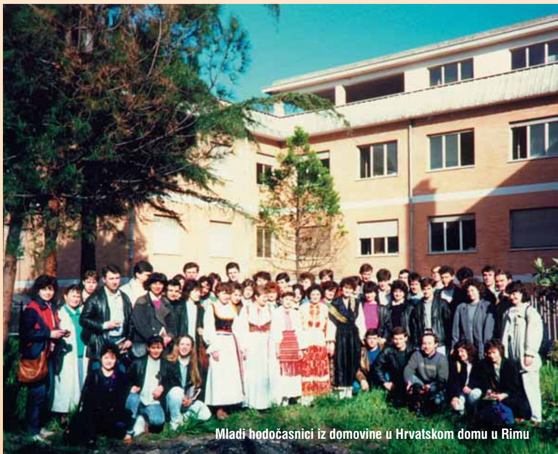
Mladi hodočasnici iz domovine u Hrvatskom domu u Rimu