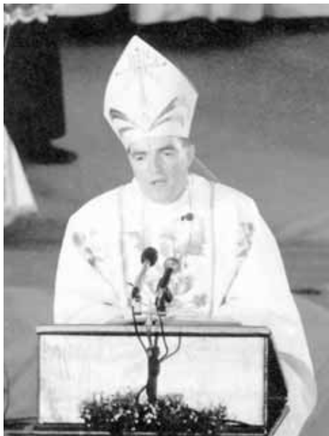
Msgr. JOSIP BOZANIĆ u zagrebačkoj katedrali, na dan preuzimanja uprave zagrebačkom nadbiskupijom, 4. X. 1997.

5. srpnja 1997. Sveti Otac Ivan Pavao II. imenovao je za novog zagrebačkog nadbiskupa do sadašnjeg krčkog biskupa msgr. Josipa Bozanića. Kardinal Franjo Kuharić, koji je do sada upravljao zagrebačkom nadbiskupijom zbog poodmakle dobi polazi u mirovinu.