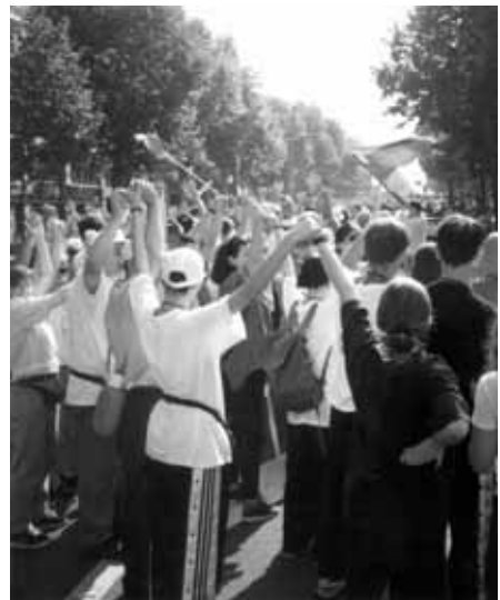
Mladi Hrvati u lancu bratstva dugom 36 kilometara okružili su cijeli Pariz 23. VIII. 1997.

Za sve naše mlade bilo je to veliko i duboko iskustvo. S ovog hodočašća, koje je za temu imalo pitanje učenika i Isusov odgovor “Gospodine gdje stanuješ? Dodite i vidjet ćete!”, te nakon susreta s preko milijun mladih iz cijeloga svijeta, naši su se mladi vratili u domovinu obogaćeni svjedočanstvom vjere tolike braće i sestara iz cijeloga svijeta, te puni novih spoznaja i poticaja za svoj daljnji kršćanski život. A za hrvatske članove Euharistijskog pokreta bio je to poseban doživljaj i veliko iskustvo susreta s braćom i sestrama istoga međunarodnog pokreta. Pariški hodočasnik