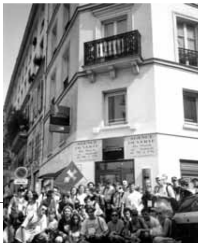
Mladi štovatelji Ivana Merza u ulici Mayet na mjestu gdje se uzdizala zgrada gdje je stanovao Ivan Merz za vrijeme svoga boravka u Parizu.

Članovi Euharistijskog pokreta mladih iz Hrvatske za vrijeme svoga boravka u Parizu prigodom 12. svjetskog dana mladih u kolovozu 1997. pohodili su dva mjesta povezana s Ivanom Merzom. Prvo je bila ulica, rue Mayet, u kojoj je stanovao Ivan Merz. Stara je zgrada u kojoj je bio Ivanov stan srušena, a na njezinom je mjestu izgrađena nova kuća pred kojom su se mladi zajednički fotografirali. Zatim su pohodili crkvu sv. Vinka Paulskog u koju je Ivan Merz često dolazio na sv.misu i primao sv.pricest. Nije bilo vremena da se pohodi Manrese, u Clamartu gdje je Ivan obavljao duhovne vježbe. Pročitani su Ivanovi odabrani tekstovi koje je napisao u Parizu, napose onaj o oblačenju redovnice benediktinke.