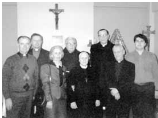
Inicijativni odbor Doma hrvatskih hodočasnika u Rimu u kapeli Doma nakon sv. mise zahvalnice za desetgodišnjicu svoga rada i postojanja Doma

Posebno svečani trenutak za Dom bilo je imenovanje sarajevskog nadbiskupa Vinka Puljića za kardinala. Bilo je to 26. studenog 1994. godine. Nakon što je u posebnom obredu u Bazilici Sveto-ga Petra Papa podijelio kardinalski šešir nadbiskupu Vinku Puljiću, svečana proslava ovog povijesnog događaja održana je u Domu hrvatskih hodočasnika. Nakon imenovanja Kardinal Puljić odjeven u svoj kardinalski grimiz došao je u Dom zajedno s banjalučkim biskupom Franjom Komaricom, sa svojom pratnjom, rodbinom brojnim