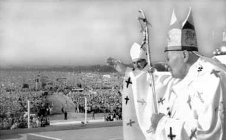
“Podite putovima svijeta graditi civilizaciju ljubavi!” - rekao je Papa milijuntnom mnoštvu mladih na 12. svjetskom danu mladih u Parizu, 24. VIII. 1997.

renima. Ovdje je bilo smješteno preko 600 mladih iz cijeloga svijeta.