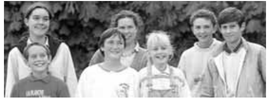
Prijateljstvo i kršćansko zajedništvo intenzivno se doživljava u ekipi - osnovnoj jedinici pokreta

U svojoj bazi pokret djeluje kroz skupine od pet do sedam članova koje se zovu ekipe. S njima je uvijek netko od odraslih, ili koji puta i netko od starijih mladih.