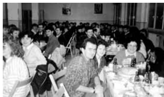
U blagovaonici Doma svaki hodočasnik nalazi ugodnu domaću, hrvatsku atmosferu. Na slici: prva grupa mladih iz Zagreba za Cvjetnicu 1988.

P. Alojzije Hartli Hrv.kat.misija Kassel