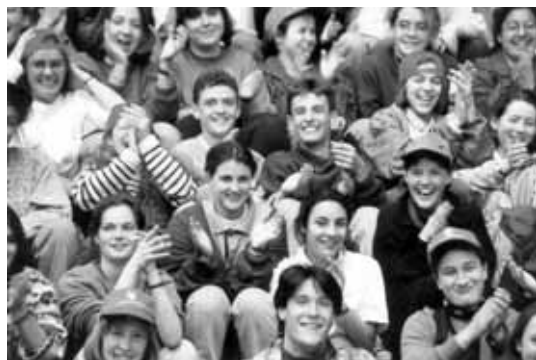
Mladi Francuzi - članovi Euharistijskog pokreta mladih